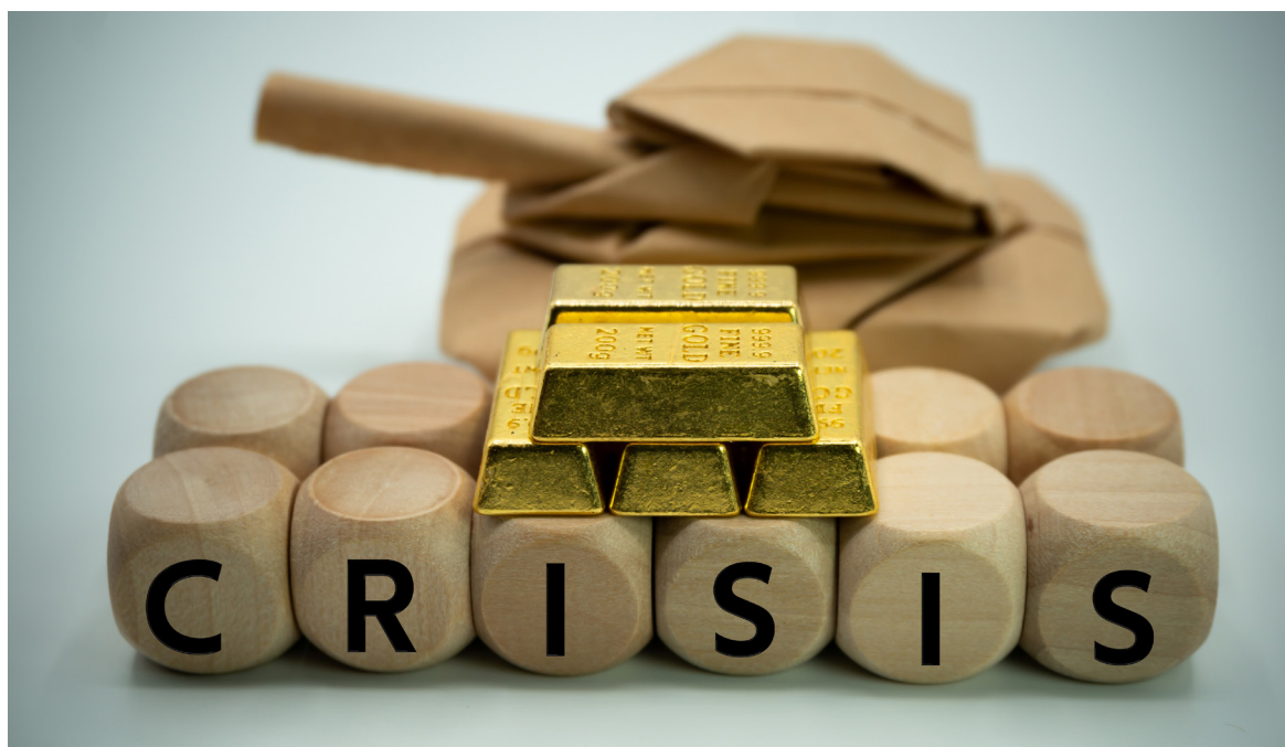
Ningún análisis del conflicto en Ucrania puede pasar por alto los aspectos económicos del mismo.

En el corto plazo, se sabe que parte importante de las reservas de Rusia han sido bloqueadas