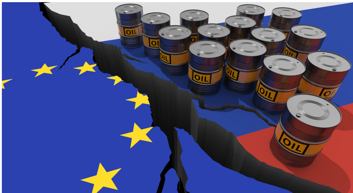
Europa se ve dividida entre su necesidad de hidrocarburos rusos y su oposición a la invasión de Ucrania.

detenidas. Al mismo tiempo, la exclusión de los bancos rusos del sistema internacional de transferencias interbancarias bloquea cualquier pago de Rusia a países exportadores (y viceversa). Todo esto hace más difícil el intercambio de bienes entre Rusia y el Perú, por ejemplo.