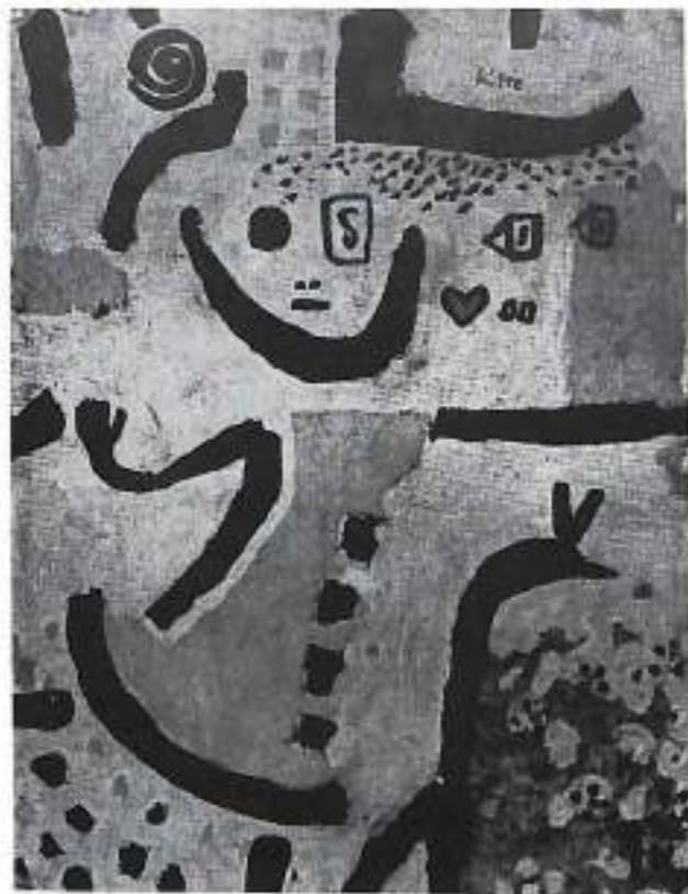
"Juego de niños" (1939) 16 2/8 x 12 5/8" Aguada y acuarela

Pintada en el año anterior a su muerte, esta obra se inscribe entre las que tipifican el último periodo del pintor, ya por los gruesos trazos, ya por la extrañeza que produce.