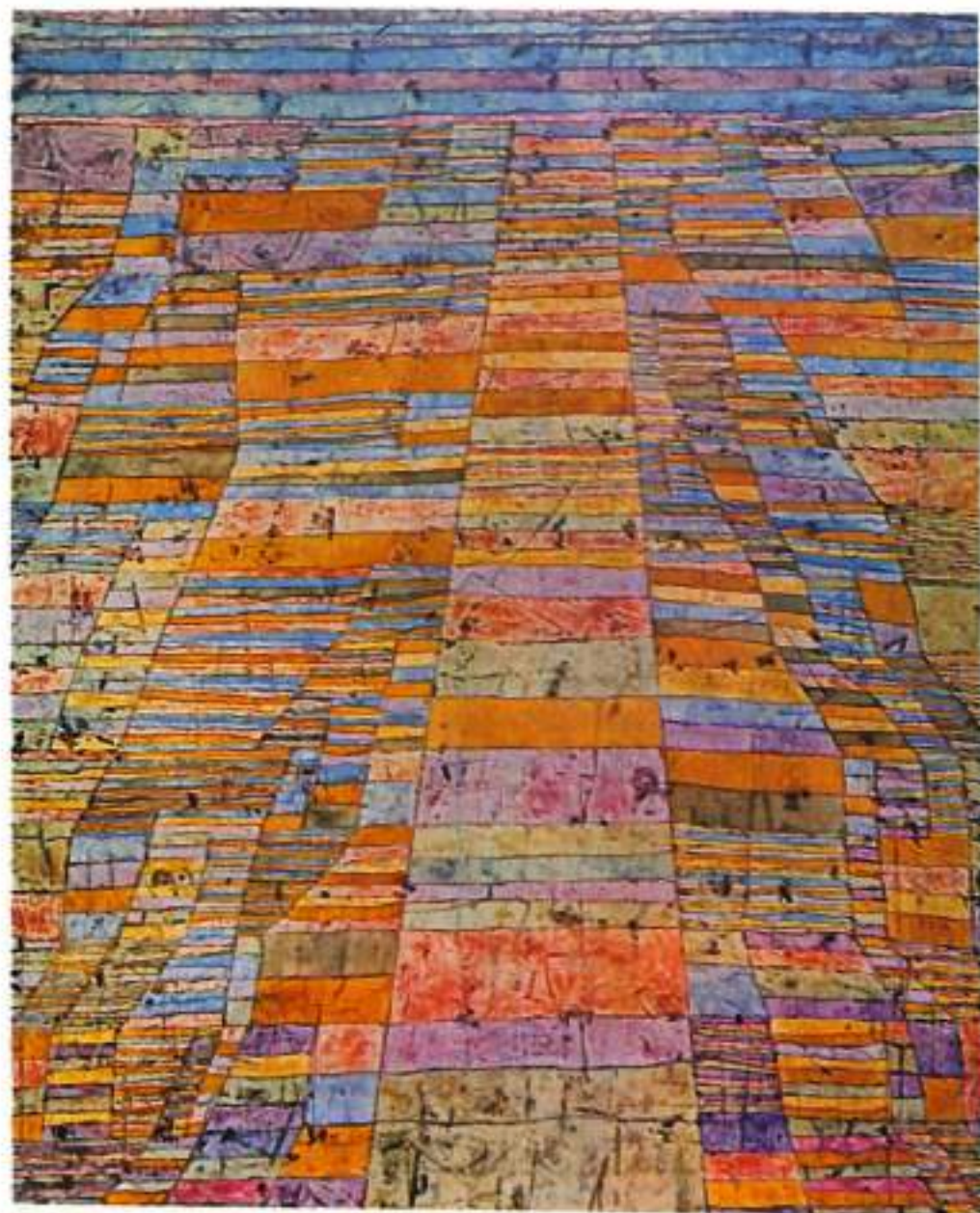
"Via troncal y vías laterales" (1929) 83 x 67 cm. Oleo s. tela

Klee visitó Egipto de diciembre de 1928 a enero de 1929. Esta pintura es un trasunto de su experiencia del paisaje de ese país: metamorfosis del mismo en una forma abstracta que sigue su patrón compositivo típico, llevado en los términos de una diáfana amplitud y un colorido vario y fluyente. Su título es coherente con la imagen.