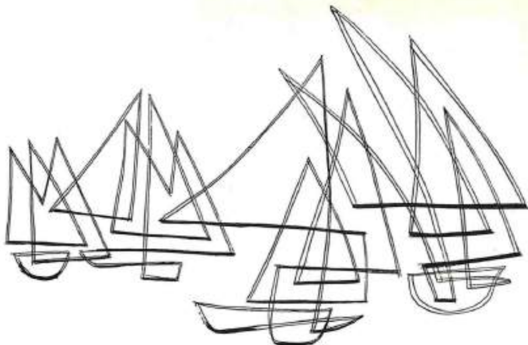
"Barcos de vela en suave navegación" (1927) 30.5 x 46 cm.

Klee fue magnífico dibujante, de línea sutil, dócil y extraordinariamente sensible, apreciable por igual en sus dibujos y pinturas. El mismo dijo, al definir su arte, que era asunto "de sacar a pasear la línea." ¡Y en qué maravillosa aventura se convirtió ese paseo!