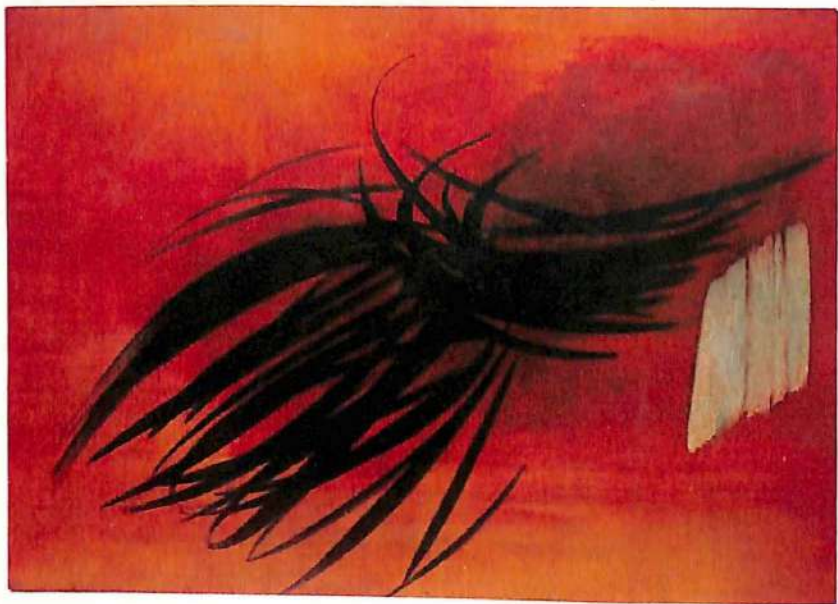
HIARTUNG. Lirico Abstraccio