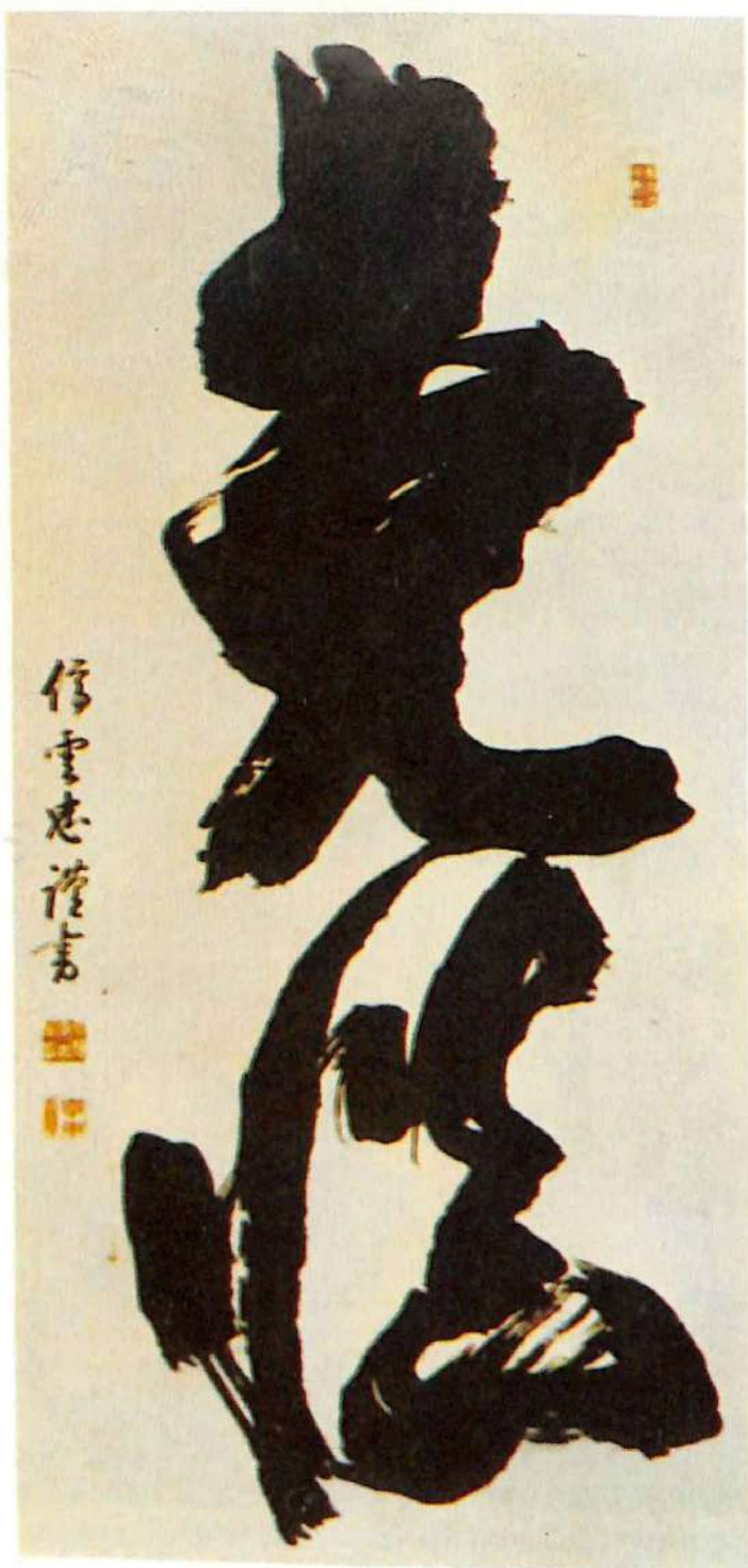
Antigua caligrafía japonesa. La energía controlada de estos signos inspiró a artistas occidentales.