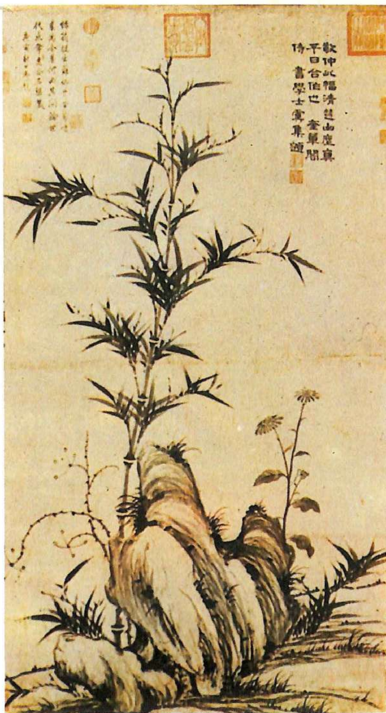
Arte chino (época Yuan): Bambú y Crisantemos. Rollo vertical firmado por K'o Chiu-ssu (1290 - 1343). Tinta sobre papel.