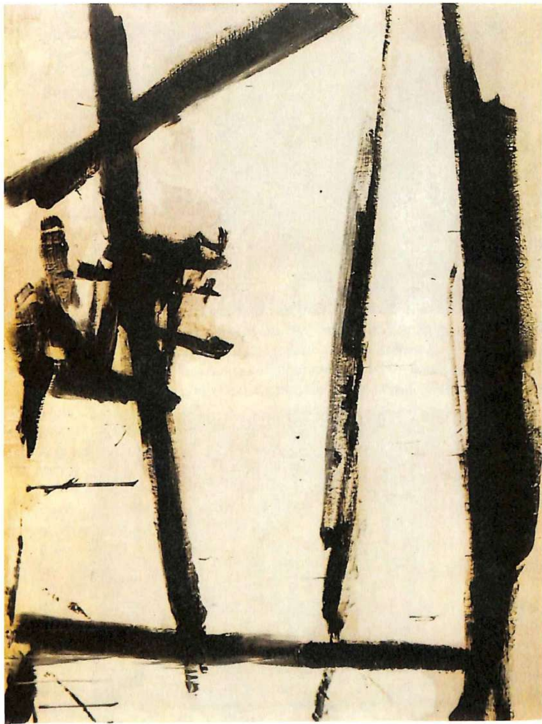
Franz Kline: "Pintura No 2" (1954). Los gestos amplios, sobre un formato gigantesco, proceden de los ideogramas extremorientales.