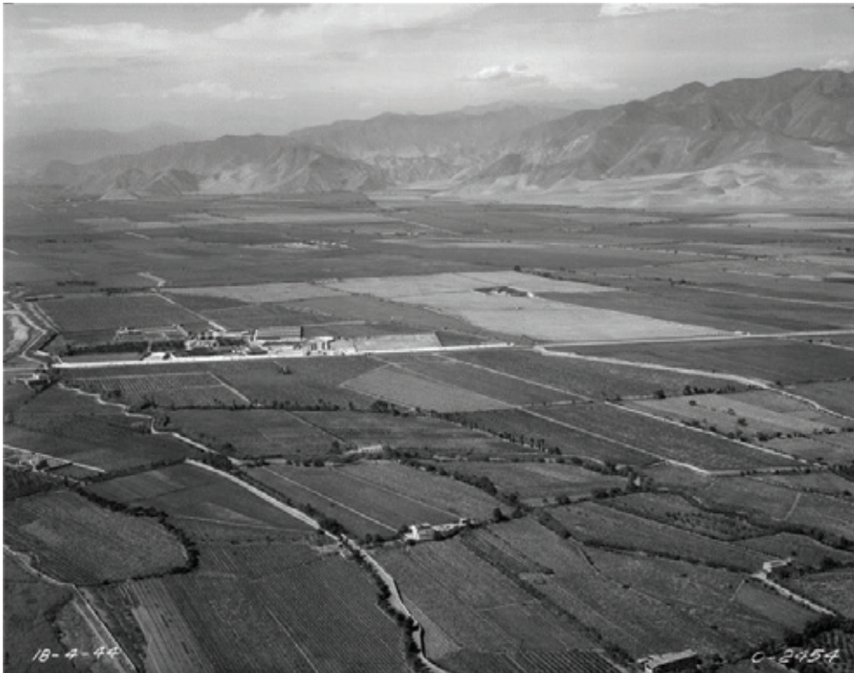
Fotografía del valle de Lima, 1944

Nota. [Fotografía del valle de Lima con vista de la hacienda San Juan] (1944, 18 de abril). Fotografía 0-2454, Servicio Aerofotográfico Nacional.