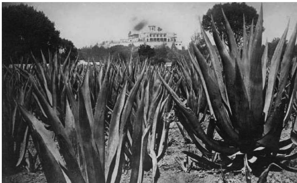
Fig. 12. Castillo de Chapultepec.

México, sobresaliendo algunas en las que se sospecha una mirada turística, por ejemplo, aquellas en las que Jackson tendió a retratar temas que consideró típicamente mexicanos, como cactus e indígenas. En especial, el fotógrafo mostró un interés particular por el agua y sus medios, de este modo retrató fuentes, aguadores y, por supuesto, acueductos (figura 11). Jackson es un fotógrafo que sorprende, en algunas de sus fotografías trasciende el aspecto costumbrista antes mencionado