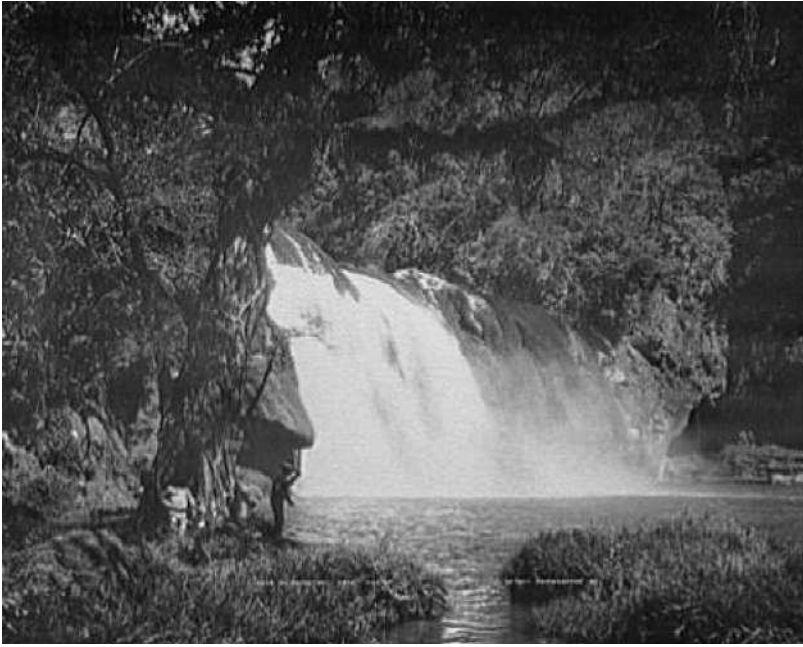
Fig. 6. El Salto del Abra, México.

Las imágenes con temas sobre la naturaleza mexicana que podrían ser tomadas como vistas fastuosas que complementaban a modo de adorno una presentación sobre el país, también jugaron un papel importante en demostrar un aspecto de interés comercial: la variedad natural del país. Al mostrar esta diversidad se ilustraba al posible inversionista con ejemplos de diferentes climas y regiones que