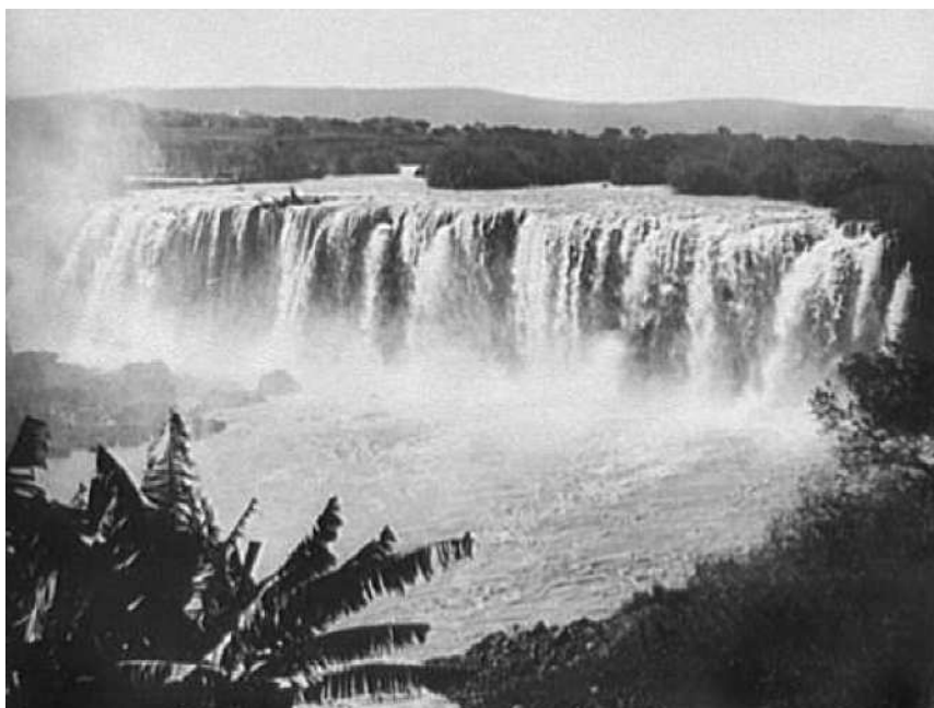
Fig. 5. El Salto de Juanacatlán, México.

conciencia de la plasticidad de la imagen (figura 4). De esta manera, Jackson construyó visualmente una imagen más sobria, espectacular y abstracta. Por ejemplo, los cactus no se ven como parte de una construcción tecnológicamente primitiva sino como símbolo del exotismo mexicano. La composición en perspectiva que forma el acueducto y la hilera de cactus componen una especie de barrera visual