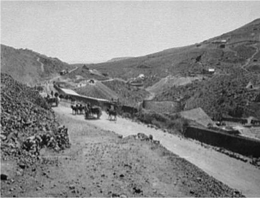
Fig. 8. M.C. Ry. entre Zacatecas [Zacatecas] y Guadeloupe [Guadalupe].

buscaban exponer las necesidades de inversión en áreas ricas pero faltas de la tecnología adecuada. Fue el mismo caso en las fotografías de Tamasopo, en San Luis Potosí, en las que se apreciaba una hacienda que producía azúcar. En estas fotografías es evidente que más que estar dirigidas a posibles turistas se buscaba ofrecer imágenes que resultaran atractivas para un público estadounidense interesado en la