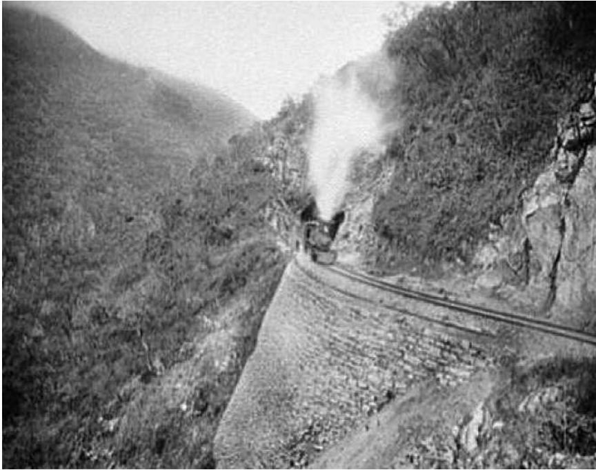
Fig. 9. Túnel "5" Tamasopa [Cañón Tamasopa].

vecina de los Estados Unidos, es un país relativamente poco conocido aquí". 18 A continuación, el autor, en las siguientes veinte páginas, hace un recuento de la historia del país, desde los primeros pobladores hasta su época actual. El lector, a medida que iba leyendo sobre los aztecas, la intervención francesa y los avances del gobierno de Porfirio Díaz, podía saciar su curiosidad observando impresas en