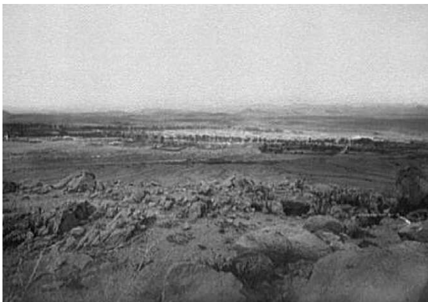
Fig. 2. Chihuahua, México.