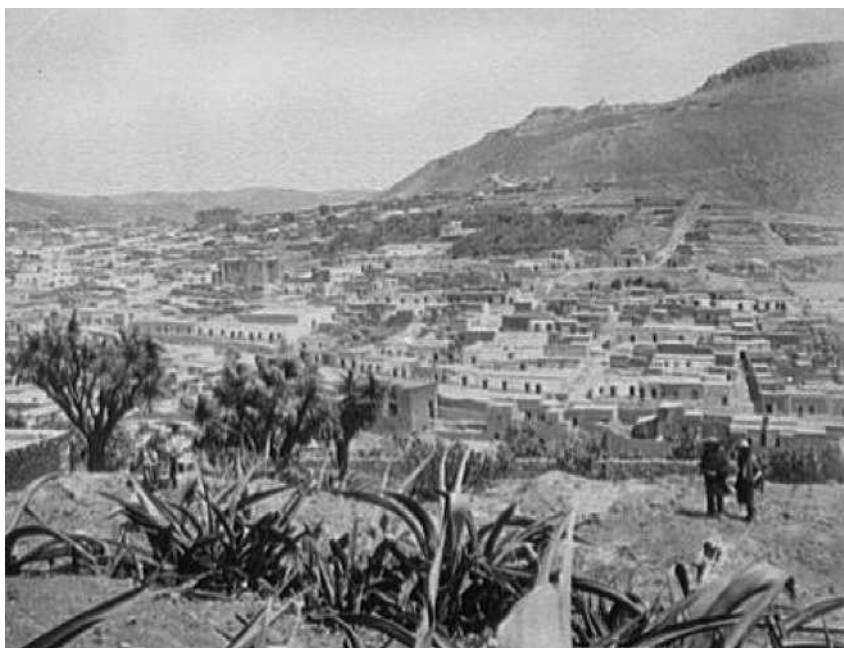
Fig. 3b. Zacatecas [Zacatecas] from below railroad station. Fotografía publicada como placa única y como sección derecha de un panorama de dos placas.

recen con mayor claridad en la imagen izquierda. Al incluir a los personajes del tren, que resultaban familiares al espectador estadounidense, Jackson incorporó, discretamente, al espectador en la escena. Además, al resaltar visualmente las figuras de los mexicanos hay una guía intencionada de la mirada a lo que desde el tren se podía apreciar: el tren y sus pasajeros se deslizan tranquilamente por un pintoresco panorama.