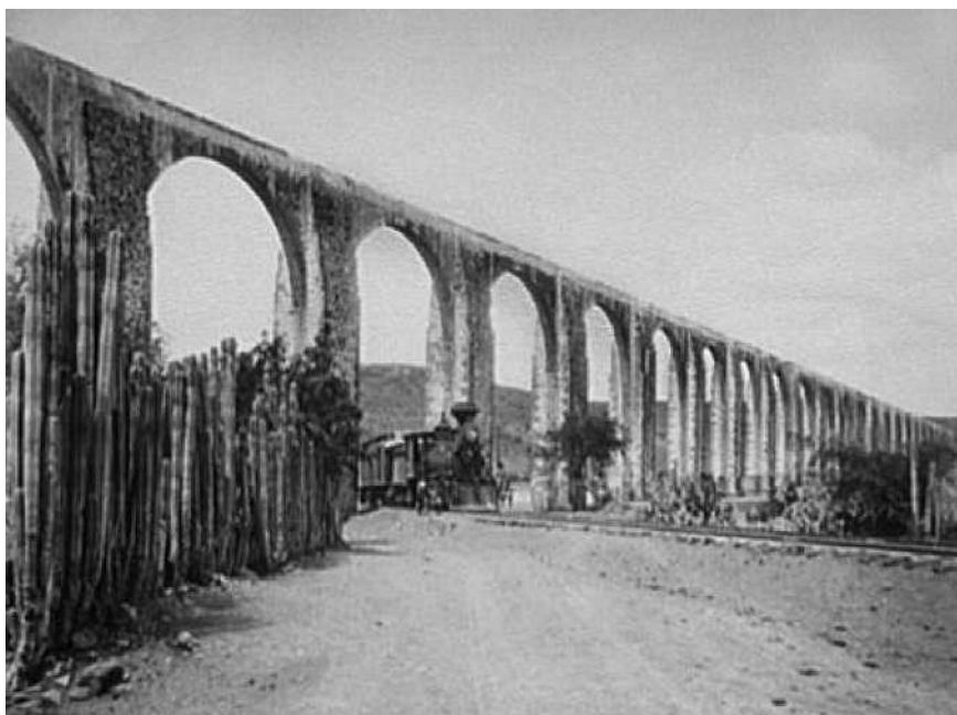
Fig. 4. El acueducto de Querétaro, México.

jardín había sido delimitado con una barda viva de cactus. En la pared de la vivienda se puede ver en un primer plano a una niña, aunque las figuras más significativas son las de un hombre del campo y una mujer con rebozo que miran a la máquina que atraviesa el acueducto. La imagen resulta casi caricaturesca: el paso del progreso simbolizado en el tren, a través de un país atrasado, es decir, un país con casas de piedra y bardas fabricadas con plantas. Se trata de una especie de display de la modernidad ante la actitud expectante de los pobladores. El vínculo histórico está presente en la imagen mediante la presencia del acueducto, símbolo de la ingeniería