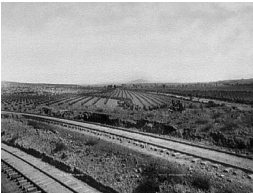
Fig. 7. Lechería, México.

co, en la que se ven las vías del tren en primer plano, y al fondo campos de cultivo que se extienden hasta el horizonte. En esta imagen Jackson abandona el pictorialismo presente en imágenes como la escena bucólica del Salto del Abra, en la que hay fuertes reminiscencias del romanticismo decimonónico y ofrece una imagen plásticamente moderna, compuesta básicamente por líneas que juegan con la perspectiva. Así, se ofrece un paisaje