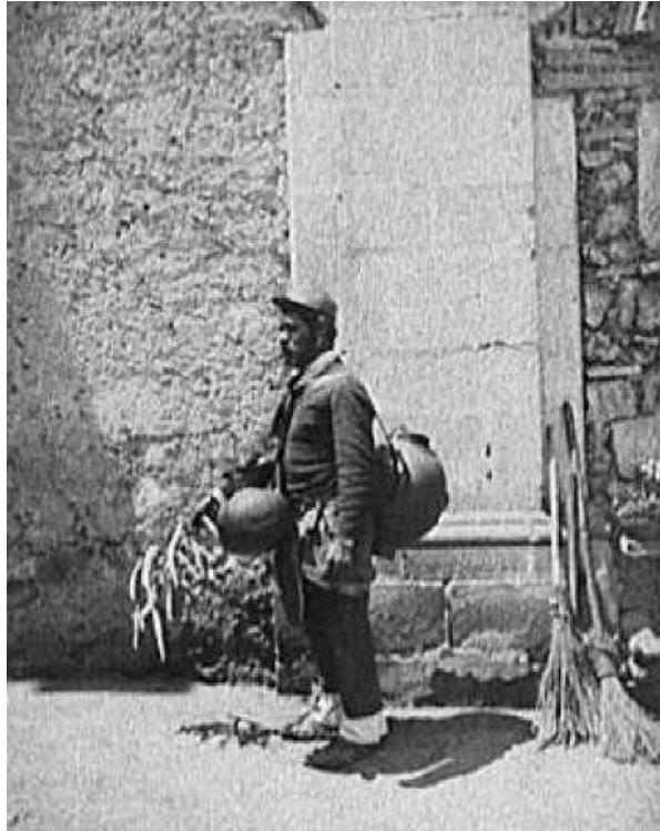
Fig. 11. Aguadores, México.

Finalmente, el trabajo de Jackson en México no se reduce a la comisión del FCM, y existen cientos de imágenes que todavía no se han analizado a profundidad y cuyo impacto en la construcción de la imagen de México en el extranjero fue seguramente considerable. En 1897, Jackson vendió sus negativos a la Detroit Publishing Company. Esta empresa, que imprimía vistas y postales, se convertiría en una de las