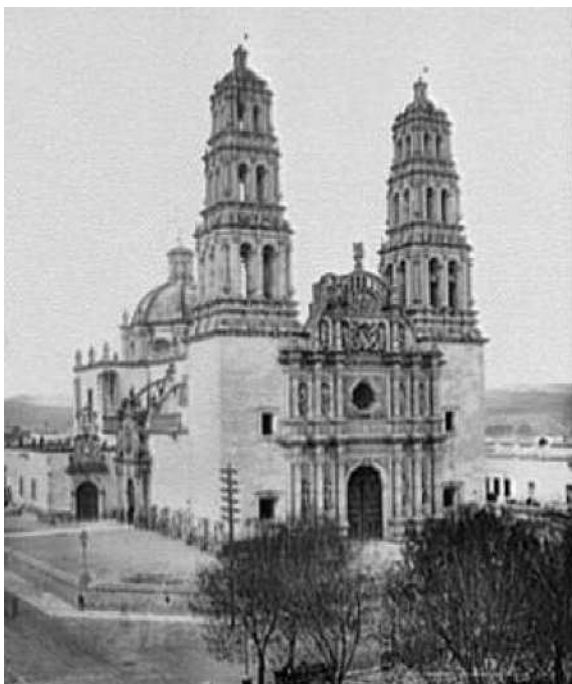
Fig. 1. La catedral, Chihuahua, México.

Siguiendo el camino del norte hacia el centro del país, en Zacatecas, Aguascalientes y Guanajuato, Jackson continuó fotografiando vistas que representaban a cada ciudad relacionándolas con el paso del tren, y en el mismo tono como lo había hecho en Chihuahua. Figuras de tipos mexicanos se ven a lo lejos, pequeños ejemplos de los habitantes de las antiguas ciudades, los cuales, además de agregar información sobre los habitantes de esas tierras, otorgaban un punto de medida para que el espectador se pudiera ubicar en las dimensiones y el espacio. Por ejemplo, en las dos imágenes que formaban una vista de la ciudad de Zacatecas, tomadas desde la estación del ferrocarril, se combinan armónicamente elementos