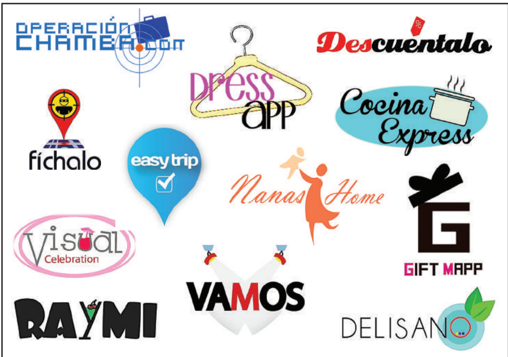
Figura 3. Logotipos creados para ideas de negocio en comunicación digital