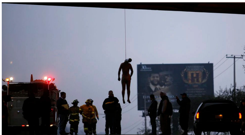
Fotografía: Guillermo Arias (2009)