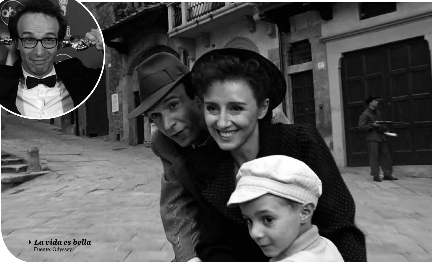
▶ La vida es bella