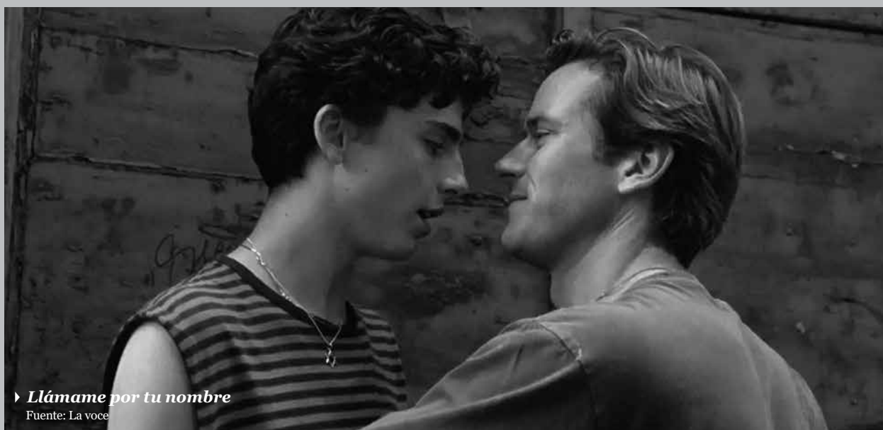
► Llámame por tu nombre

El reverso social de ambos filmes aparece en la ganadora del Óscar Llámame por tu nombre ( Call Me by Your Name , 2016), donde la clase media es el espacio de la libertad, libre de prejuicios y progresista. Aquí los hijos encuentran en los padres el único espacio de cariño y seguridad, puestos en escena con una reminiscencia perfecta al mundo de A nuestros amores ( À nos Amours , 1983) de Maurice Pialat. El hogar puede ser causa de escape y ruptura social, el espacio inicial de la rebelión, pero también puede ser el único lugar donde los hijos encuentran la fortaleza dentro de esa comodidad. La casa, la vida de campo y la familia como símbolo de un bastión que aún hay que preservar: el único lugar para el consuelo.