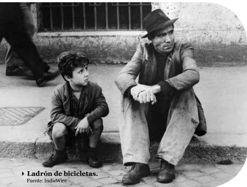
► Ladrón de bicicletas.

Completando los Óscar ganados por Italia en el ámbito de la categoría más importante para las películas extranjeras, este país europeo triunfó con tres títulos más: Investigación de un ciudadano libre de toda sospecha ( Indagine su un cittadino al di sopra di ogni sospetto , 1970) de Elio Petri,