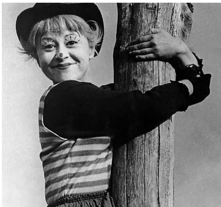
► La strada

¿En qué radica la maestría de Guadagnino? En su capacidad de vestir adaptaciones con un estilo del melodrama poderoso que no requiere exageraciones pero sí atavismos, porque pareciera ser que ante todo el cineasta italiano es un esteta, a pesar de su afición a ciertas fórmulas del cine de qualité y lo artificioso. Por ello, no es casual que se haya interesado en realizar el remake de Suspiria , pero no por ser necesariamente un fiel amante del subgénero, sino porque los decorados y la inspiradora herencia de Dario Argento le permiten ponerle su cuota de glamour y fascinación a las formas y los escenarios abiertos o de detalle del crimen-arte.