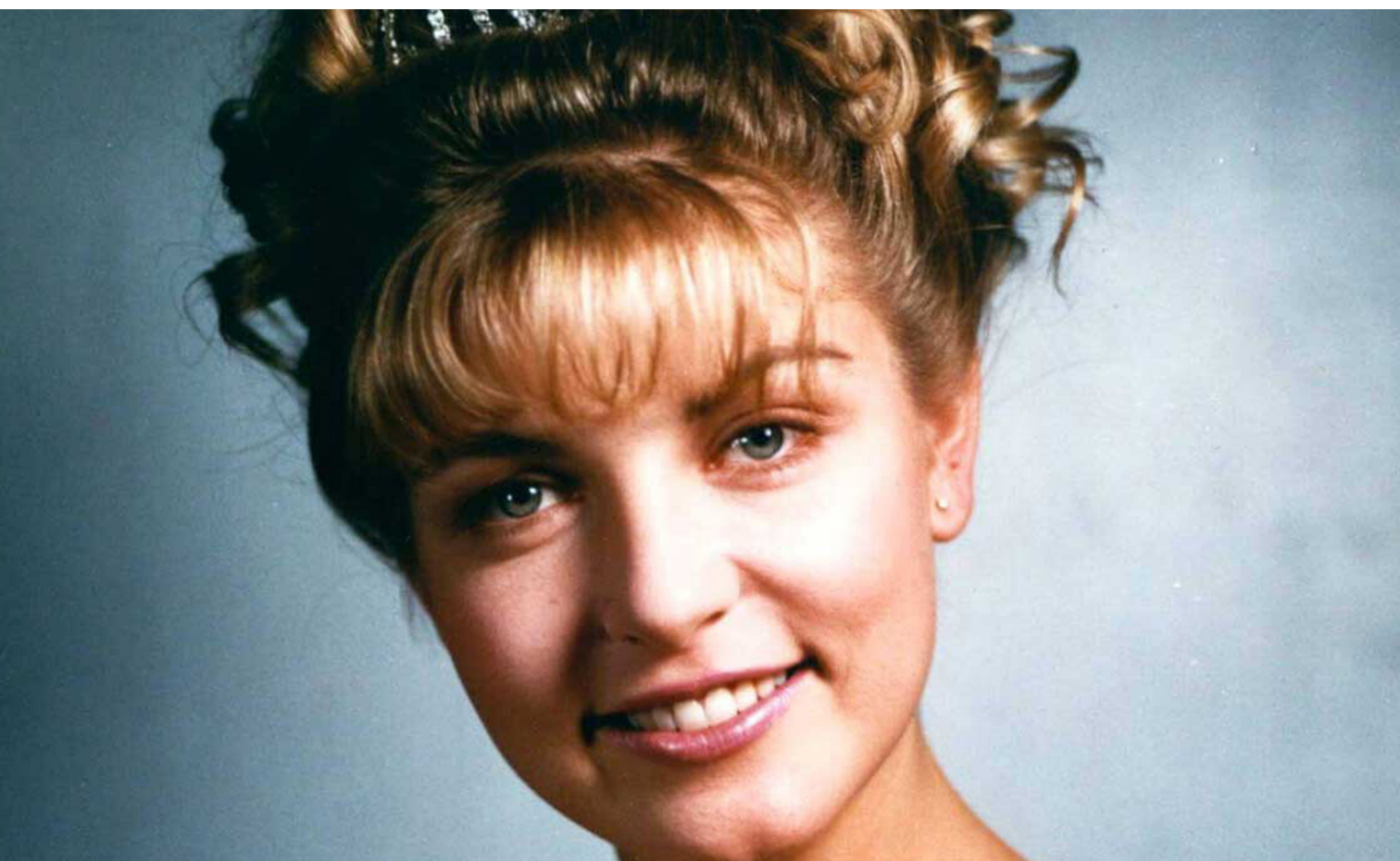
TRAGEDIA. La foto en el anuario de Laura Palmer. Esta icónica imagen fue encontrada en los homenajes póstumos y en los altares de los fans dedicados a David Lynch luego de su muerte.

aparece en la reunión de emergencia que convoca el alcalde del pueblo para anunciar el toque de queda. Su aparición en la serie es llamativa, porque carga un pedazo de tronco como si se tratara de un bebé y, para capturar la atención del auditorio, enciende y apaga insistentemente la luz.