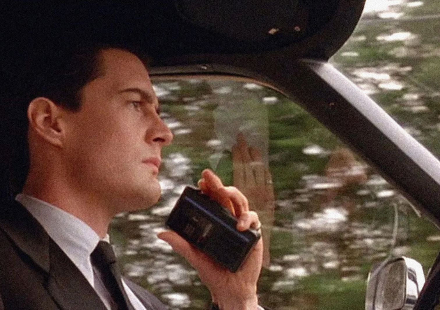
AGENTE ESPECIAL DALE COOPER: “Diane, 11:30 de la mañana, 24 de febrero. Entrando al pueblo de Twin Peaks”.

Marshall), el dueño de la motocicleta que vimos en el video de las dos amigas. Ahora bien, en este bar no suenan los disparos que podríamos asociar a cualquier film noir , sino que se puede escuchar a Julee Cruise cantando Falling mientras se cuecen y revelan secretos y traiciones a su alrededor. Un hombre casado tiene una cita con una mujer cuyo esposo está preso. Donna escapa de casa para encontrarse con un prófugo de la justicia. Su novio, al verla, le increpa que ella y Laura “son iguales” mientras tironea de su cuerpo. La violencia escala y, de pronto, medio bar acaba involucrado en una pelea. La voz aterciopelada de Julee Cruise se cuele entre tanta oscuridad: “The sky is