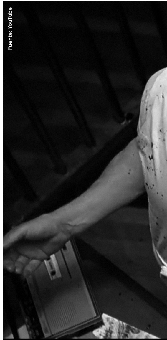
Foto: Jason Voorhees, personaje de la saga Martes 13