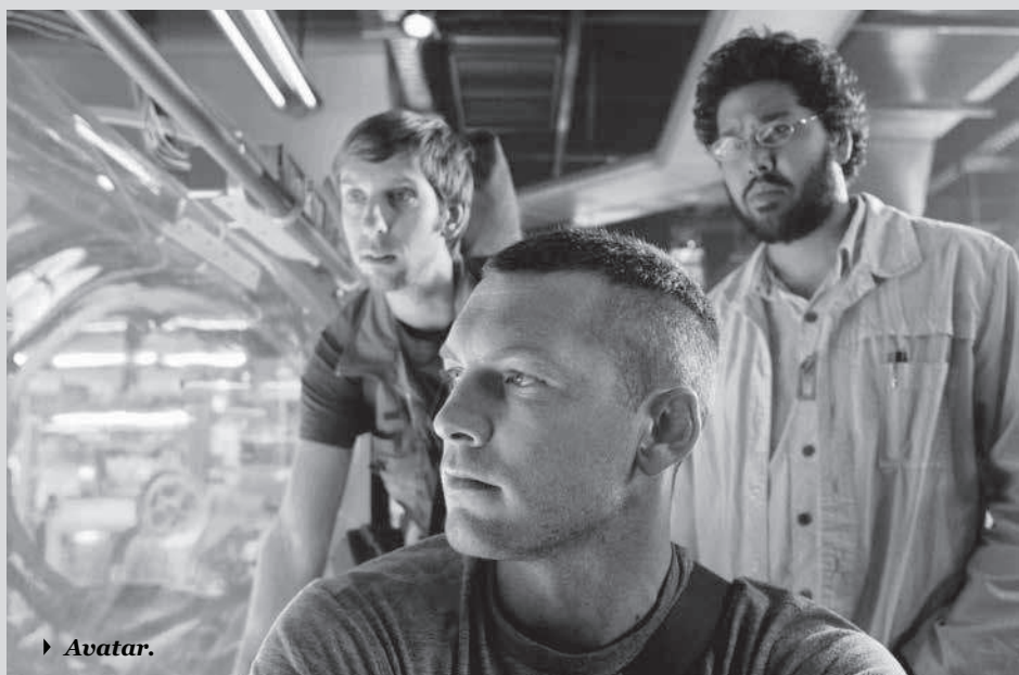
► Avatar .

pectador promedio que asiste a algún multicine un martes de 2 x 1 o, tal vez, un jueves de estrenos. Aquel que va a una sala de cine no necesariamente a reflexionar y analizar profundamente la película que va a ver, sino que busca entretenerse, durante dos horas aproximadamente, con los efectos visuales de una película como Avatar ; el que va a espectar la última película de Johnny Depp o a dejarse bombardear por una lluvia de efectos especiales e imágenes como en Transformers . Aquellas