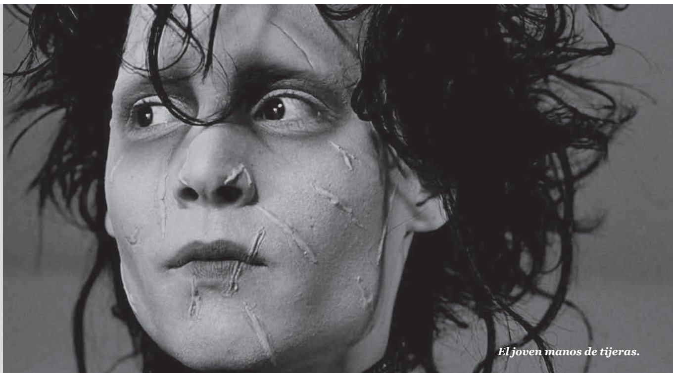
El joven manos de tijeras.

Lo que ahora sí resulta extraño es que esta atracción por personajes timburtonianos del más allá empaten con un personaje posgótico como el que personificó el desaparecido Brandon Lee. Es que también aparece la cuota de lo real: un rodaje complicado, el protagonista muere accidentalmente y el discurso del regreso de la muerte aparece en El cuervo en una doble lectura, dentro y fuera del filme. Si hay una película por antonomasia que refleje la rabia, la desazón y la mística de los emos es aquella cinta de Proyas, donde una víctima resucita con superpoderes para vengarse de los asesinos de su novia. El móvil pasional.