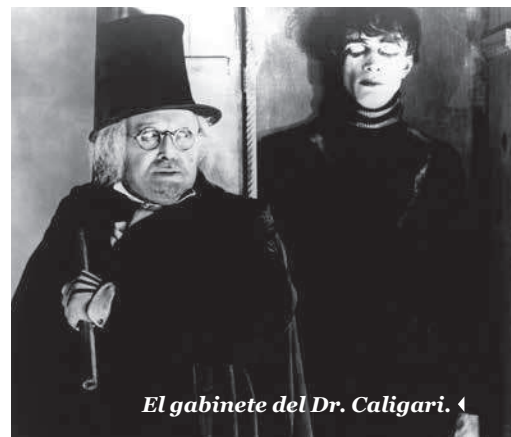
El gabinete del Dr. Caligari. ◀

¿Podría ser La chica del dragón tatuado , de David Fincher, una película emo ? ¿Lisbeth Salander, encarnada por la actriz Rooney Mara, entraría en el imaginario emo solo por contar con algo de ese spleen anhelado de aislamiento, revancha, sufrimiento y oscuridad? ¿Por qué sí El cuervo de Alex Proyas? Parece que para entrar al universo de afinidades filmicas de la cultura emo habría que contar con una cuota de sublimación, de sentimiento o emoción dentro de lo oscuro y mortuorio, algo de lo que carece la cinta de Fincher. Por ejemplo, el ser creado por el doctor Frankenstein podría entrar en esta categoría “emofilica”, o incluso el zombi del Gabinete del doctor Caligari , sin embargo están muy lejos de dibujarse dentro de la sensibilidad emodark , donde el extraño, diferente o simplemente monstruoso se abre al mundo también bajo lo lúdico y lo empático: pese a la tristeza, la rebeldía y el dolor