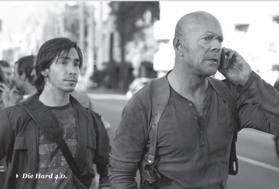
► Die Hard 4.0.

A partir del momento en que la industrialización de comienzos del siglo XX vuelve la tecnología algo familiar, las artes han representado su presencia cotidiana. Desde las alegorías industriales en el Chrysler Building hasta el arte de reproducción mecánica de Warhol, la tecnología es motivo y tema, y forma de vida a veces.