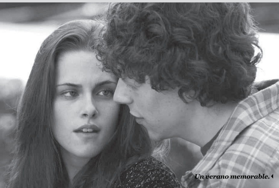
Un verano memorable. ◀

Pero existe una brigada hipster más radical aún. Son aquellos que están en contra de las películas filmadas en Estados Unidos (están identificados con películas como Amélie de Jean-Pierre Jeunet, La última vida en el universo de Pen-Ek Ratanaruang, Cashback de Sean Ellis, Once de John Carney, Soul kitchen de Fatih Akin, El paraíso ahora de Hany-Abu Assad, Las tortugas