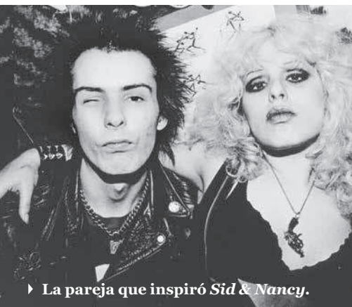
► La pareja que inspiró Sid & Nancy.

Un documental interesante realizado sobre este género anárquico y nihilista es The decline of western civilization que muestra entrevistas con bandas importantes como Black Flag, Fear, X, entre otras. El filme tiene una estética bastante descuidada, como la misma estética punk (mala iluminación, poca estilización y cámaras temblorosas). Realizado en 1981 por la directora más rockera, Penelope Spheeris, el docu-