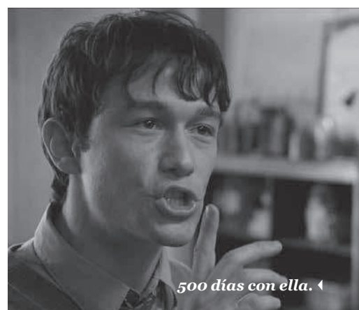
500 días con ella. ◀

Wes Anderson es el principal exponente del hipsterismo cinematográfico. Este sensei hipster ( Bottle rocket , Rushmore , Los excéntricos Tenenbaum , Vida acuática , El fantástico señor Fox , The Darjeeling Limited , Un reino bajo la luna ) sigue interesado en compilar detalles técnicos plagados de estética como los encuadres simétricos, las "tomas" submarinas y la armonía en los colores. Recorren personajes solitarios, buscando la felicidad en ambientes económica y culturalmente privilegiados; gente adulta que vive del