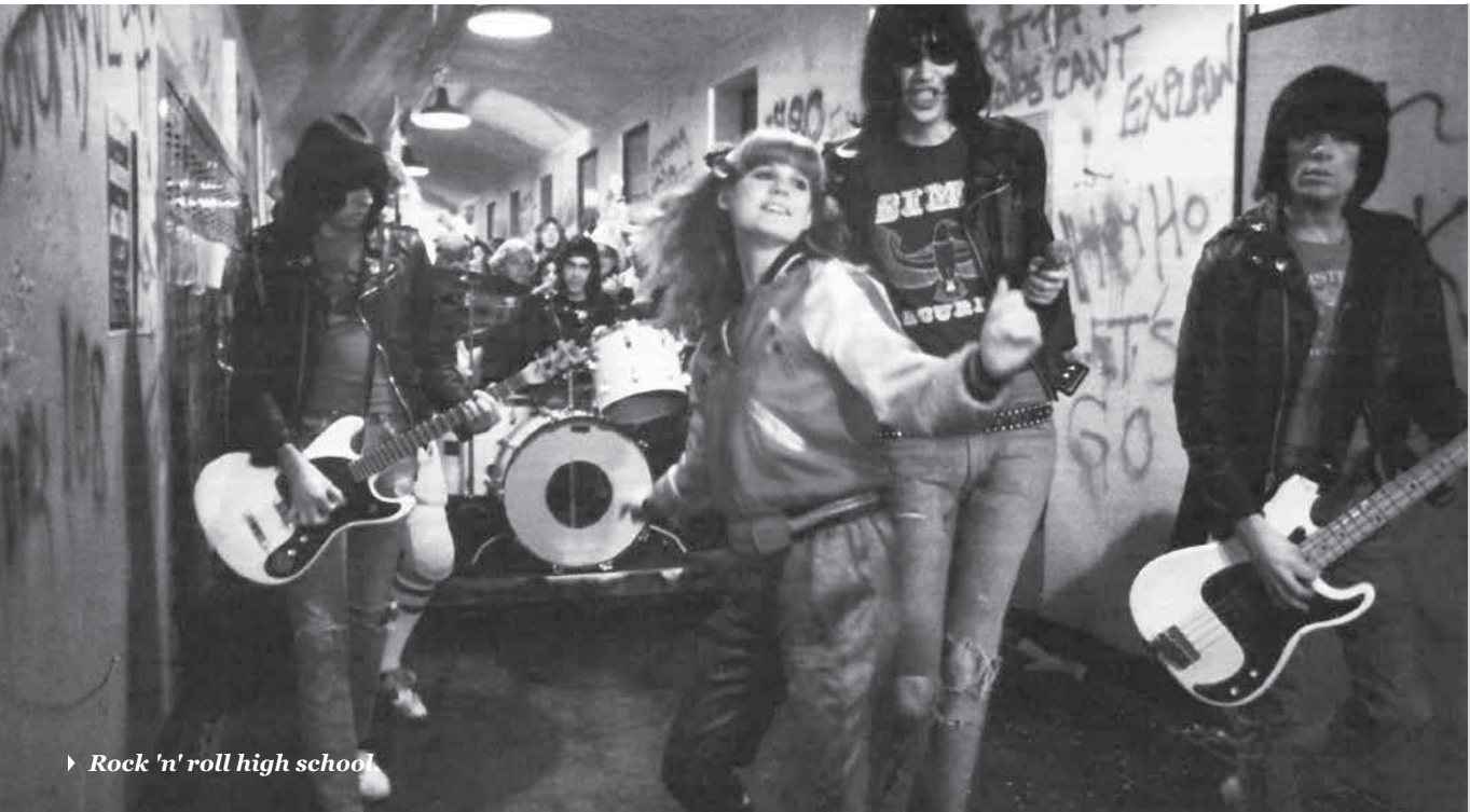
► Rock 'n' roll high school.

europeo desde Oriente. Un buen punto de partida para un largo camino animado.