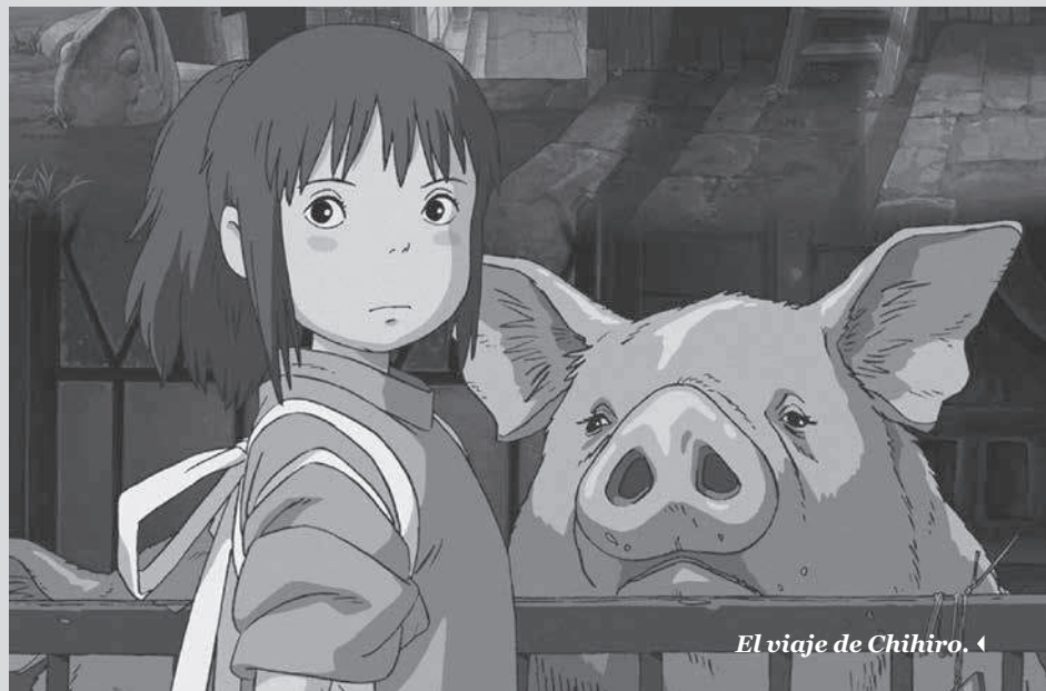
El viaje de Chihiro. ◀

Los animes recrean mitos ancestrales, pero también crean aquellos que avizoran un futuro violento y delirante. Estoy segura de que luego de leer este artículo se abrirá ante ustedes un mar de posibilidades cinéfilas que poco a poco ganará un lugar importante como lo hizo conmigo ; y quién sabe, tal vez un día me los encuentre en algún evento. Prometo no decir nada.