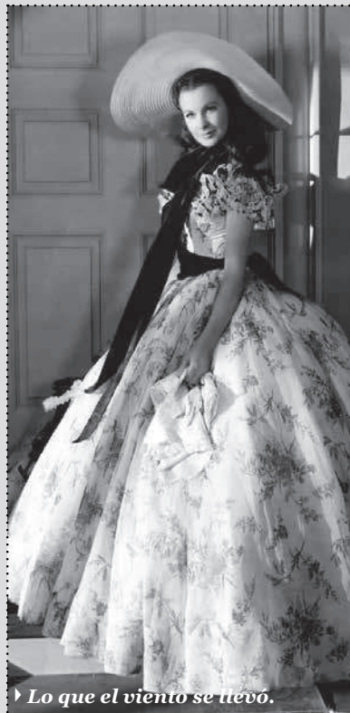
▶ Lo que el viento se llevó.