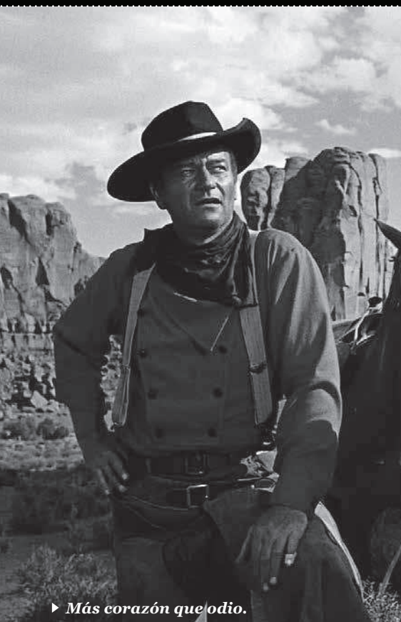
► Más corazón que odio.