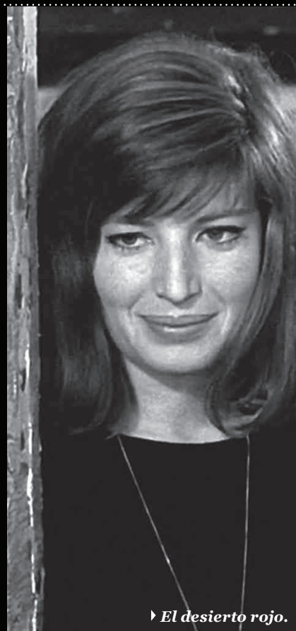
► El desierto rojo.