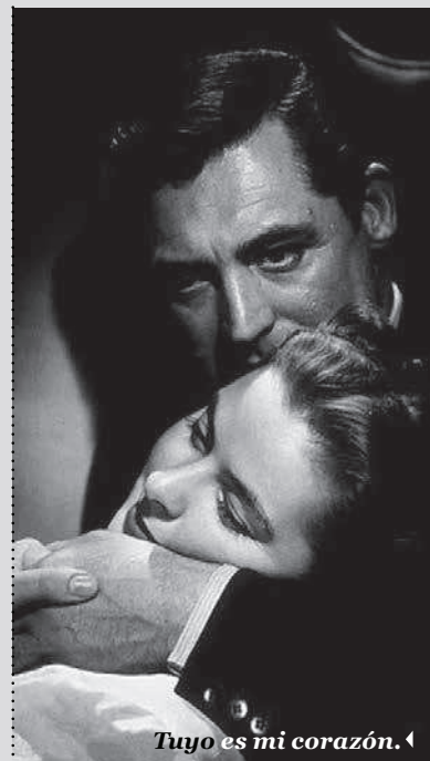
Tuyo es mi corazón. ◀