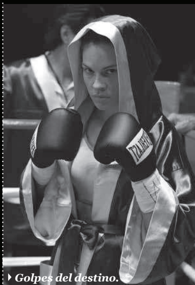
▶ Golpes del destino.