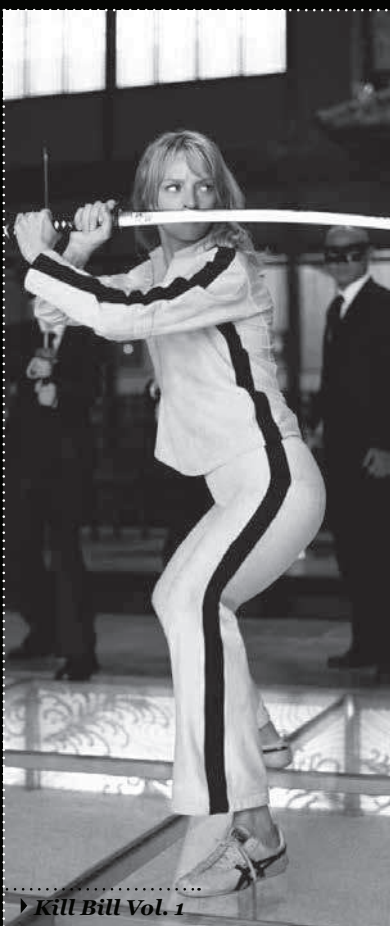
► Kill Bill Vol. 1