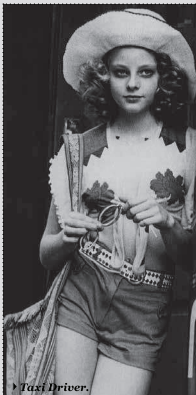
▶ Taxi Driver.