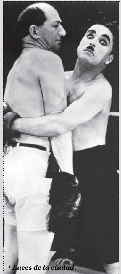
▶ Luces de la ciudad.