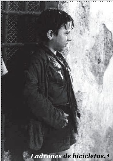
Ladrones de bicicletas. ◀