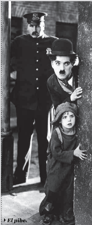
▶ El pibe.