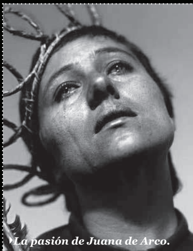
La pasión de Juana de Arco.