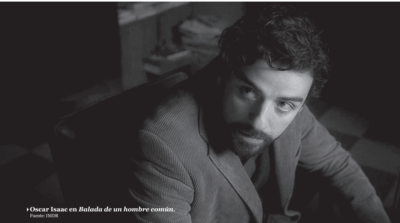
► Oscar Isaac en Balada de un hombre común .