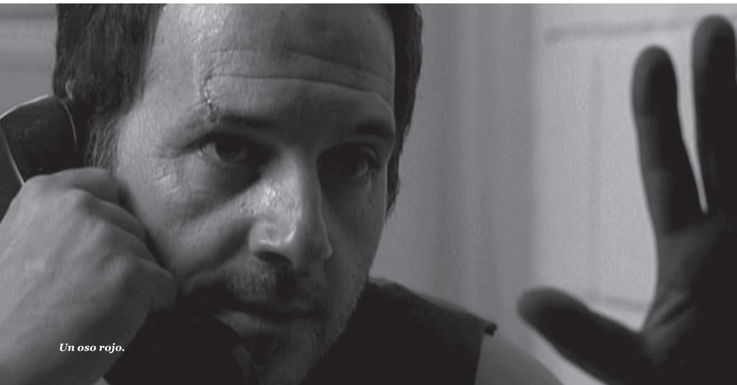
Un oso rojo.

hender y proyectar el presente social y el desastre económico.