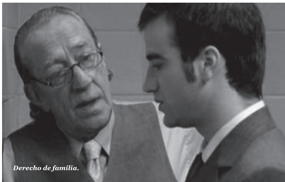
Derecho de familia.