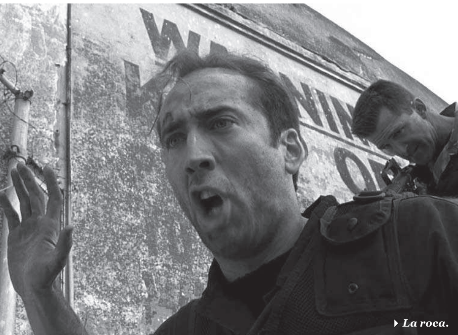
► La roca.

es injusto que esta película tenga que existir bajo su sombra toda la eternidad. Hay muchas razones por las cuales deberíamos reconsiderar este documental, algunas son: