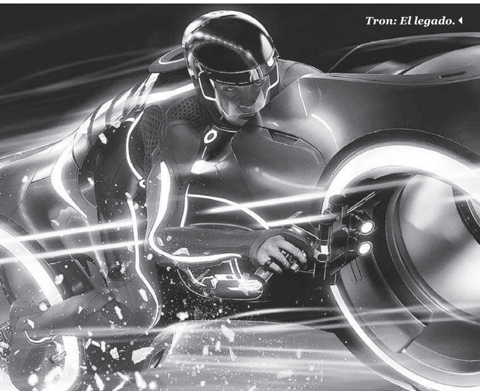
Tron: El legado. ◀