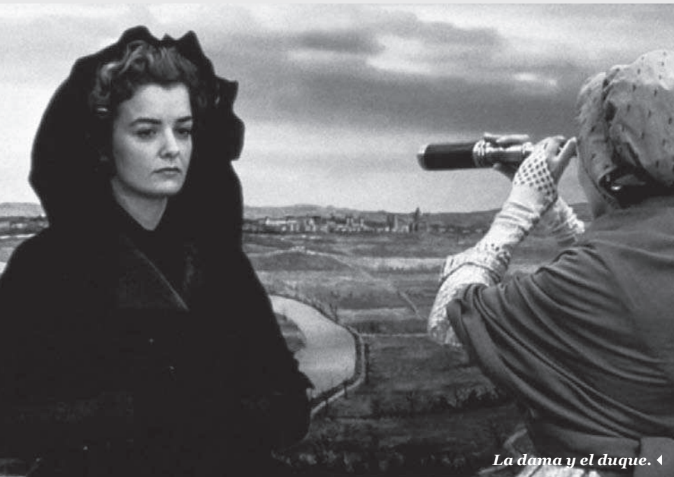
La dama y el duque. ◀

El videojuego es a la vez el agente del caos y el objeto de deseo para los protagonistas: la diseñadora de la industria de la realidad virtual Allegra Geller, interpretada por Jennifer Jason Leigh, y el practicante de marketing convertido en protector de Geller, encarnado por Jude Law. Existe un paralelo entre el procedimiento de colocación del equipo de juego con el ritual erótico previo a la penetración. Una atmósfera sexual empapa al videojuego por dentro y por fuera. Recordemos que durante el trance, los cuerpos se mueven como si estuviesen teniendo sexo.