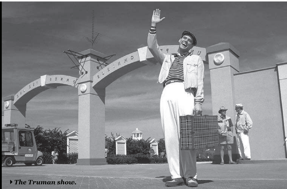
► The Truman show .

►► Una época la componen las personas que la viven. En el universo probeta de The Truman show , las certezas que provienen del encuentro con la verdad y la perfección, antes que absolutas, han devenido en artificiales; controladas. La televisión informa para que la gente permanezca desinformada, entretiene mostrando el rictus nervioso y desconcertado de un sujeto, hace negocios sobre el drama humano, incuba cómplices que operan, justifican y disfrutan del estropicio, y diluye la historia humana hasta convertirla en una mera anécdota, pues ya a nadie le interesa descifrar el hilo conductor de los hechos que se intercambian vía zapping . Así como el límite entre lo público y lo privado se ha diluido al momento de decidir qué “poner en escena” en la parrilla del prime time , la tecnología de las telecomunicaciones ha dejado de ser solo una herramienta útil del saber práctico, para alcanzar un estado que es en sí mismo un fin: manipular la espontaneidad de la vida humana, hacer de un proyecto de vida el guion de un programa de televisión de éxito, trastocar los sentimientos y decidir la extinción de una vida por razones de rating . El torrente gestual de Jim Carrey es pertinente para recrear a un Truman en estado doméstico y en quien pronto se instalarán el malestar, el escepticismo y la necesidad de escapar de aquel reducto con fronte-