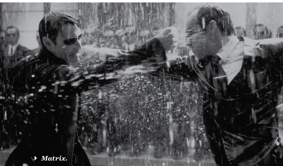
► Matrix .

Smith, un programa diseñado para disuadir a todos los que atenten contra la Matrix , no es más que algo más de esa misma simulación en la que ha estado enfrascado desde su nacimiento (al modo de Jim Carrey en The Truman show ).