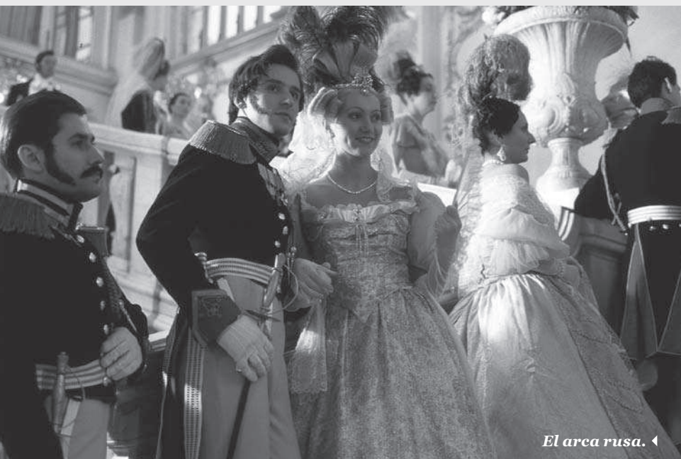
El arca rusa. ◀

La película es una proeza cinematográfica. Se realizó con una sola toma que duró alrededor de noventa minutos, y que se desplazó a través de los diversos pasillos del museo del Hermitage, uno de los más grandiosos del mundo, captando el desenvolvimiento coreográfico de más de dos mil actores y extras, al igual que tres orquestas. Toda una compleja puesta en escena no solo por sus condiciones técnicas, sino por la búsqueda de un clima de sueño; que se siente en esa enrarecida atmósfera de luces en penumbra, tenues, apagadas, que entran por las ventanas del museo y parecen de amanecer, propias de aquel momento del día en que aún dormitamos. Pero también en esos acordes de resonancias góticas que se repiten intermitentemente, mientras nuestra visión acompaña a dos personajes espectrales, inquietados por la riqueza artística y el pasado fastuoso del Hermitage: el Espía, personaje invisible representado por un encuadre subjetivo continuo, y el marqués de