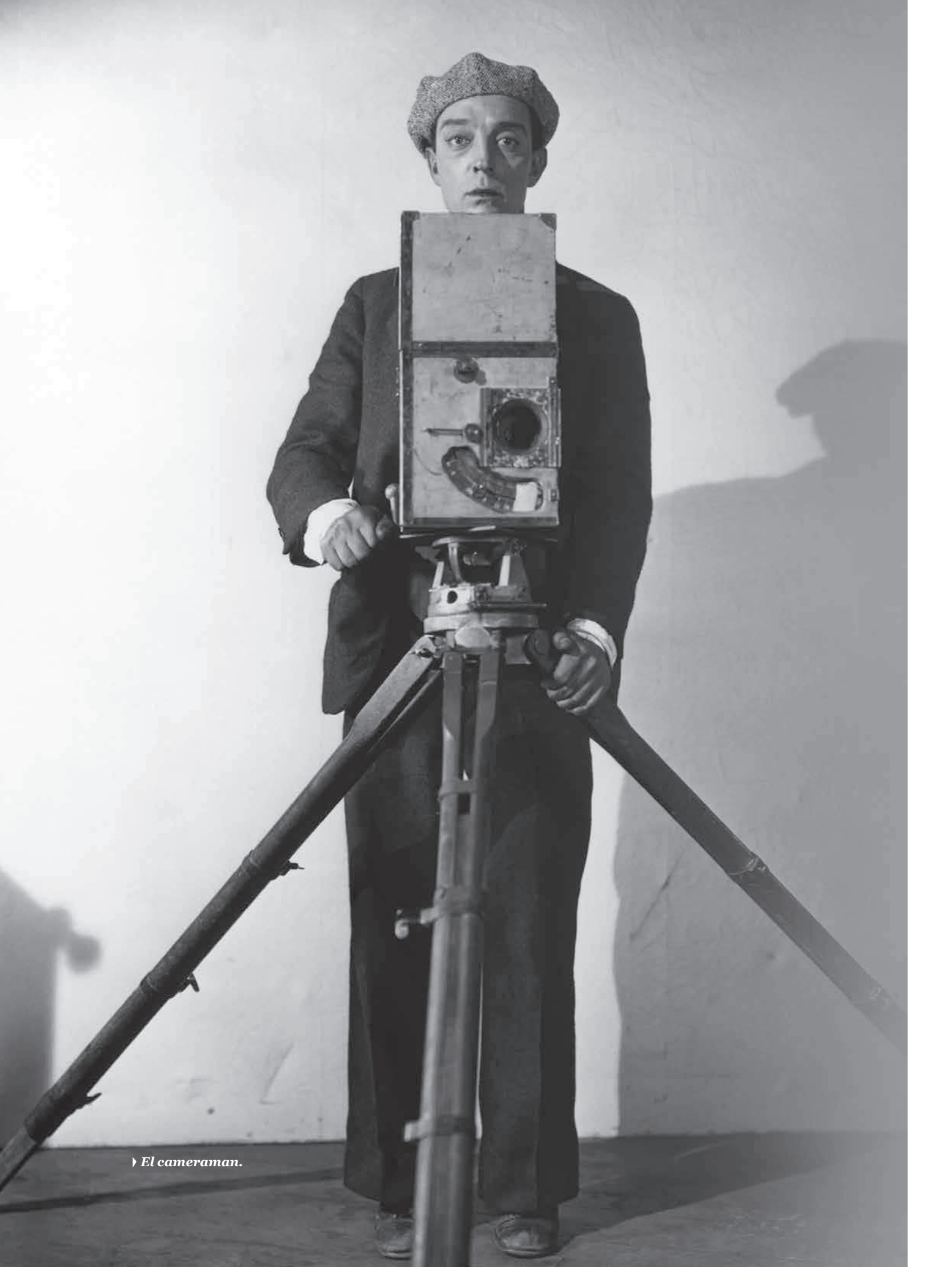
› El cameraman.