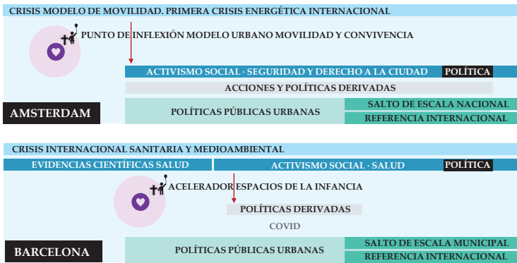
Figura 9 Diagrama comparativo de actores de los casos de estudio

Los casos analizados muestran que los procesos de transformación urbana no siguen trayectorias lineales ni acumulativas. Las innovaciones emergen y se consolidan en medio de tensiones entre lo estructural y lo cotidiano, entre lo institucional y lo social, entre resistencias institucionales y retrocesos. La capacidad de sostener el cambio urbano depende en gran medida de la persistencia de prácticas sociales que mantienen la vida urbana y sus espacios comunes.