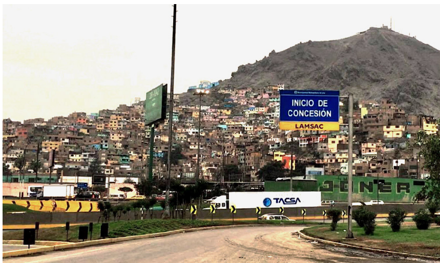
Figura 3. Viviendas informales en la ladera del Cerro San Cristóbal