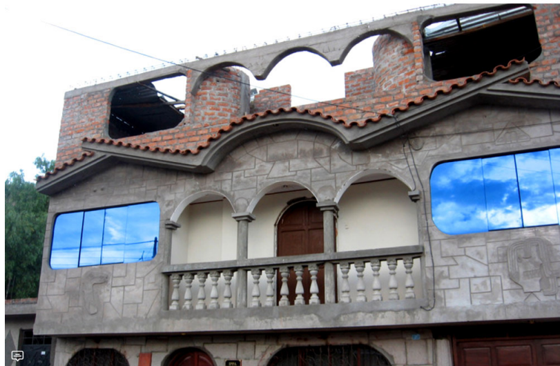
Figura 4. Viviendas informales limeñas con ornamentación de estilo clásico