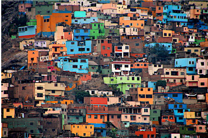
Figura 2. Viviendas informales en la ladera del Cerro San Cristóbal