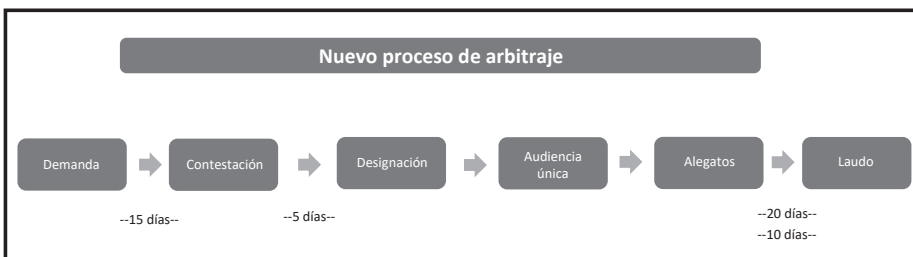
Figura 3. Tramitación

En las siguientes figuras se puede observar la tramitación del arbitraje en el Ceconar: