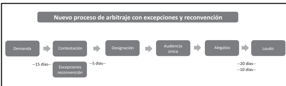
Figura 4. Tramitación con excepciones y reconvencción