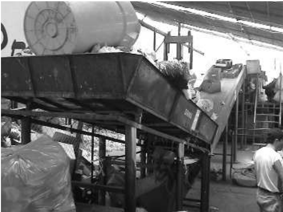
Fotografía 2 Planta de segregación de Selip, Cusco

Por otro lado, el Servicio de Limpieza Pública (Selip) de la Municipalidad del Cusco dispone de una planta de segregación de residuos sólidos, como se puede observar en la fotografía 2. En esta se clasifican y recuperan el plástico, el papel y el cartón, además de vidrios y metales, entre otros, para su comercialización y reciclado posterior. La materia orgánica es transportada al lugar denominado Rayallacta, que está ubicada en el distrito de Andahuayllillas, para su conversión en compostaje (abono orgánico), que se utiliza en la agricultura en el valle de Urubamba.