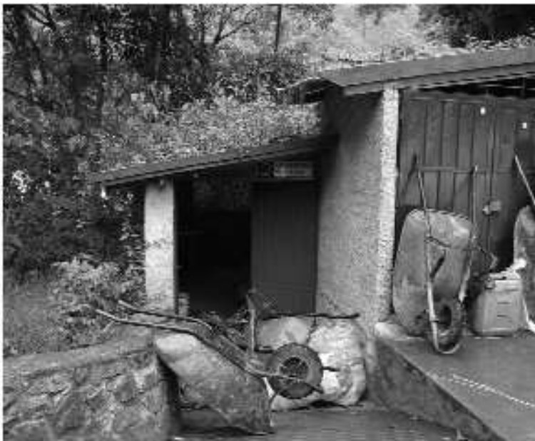
Fotografía 4 Punto de acopio de residuos sólidos en la ruta Caminos del Inca

Por otra parte, los residuos sólidos generados por los turistas en los campamentos durante el recorrido de la ruta Caminos del Inca, como se puede ver en la fotografía 4, son almacenados en diferentes centros de acopio para su posterior traslado por medio de Perú Rail hasta la estación de transferencia denominada Pachar, en Ollantaytambo, y de ahí, mediante camiones, hasta el vertido en una cantera cercana a Ollantaytambo. Hasta mayo del año pasado la disposición de residuos se realizaba en el relleno sanitario de Yuncachahuayco, fecha en que fue clausurado por oposición de los comuneros de la zona, debido a posibles impactos producidos sobre la agricultura circundante.