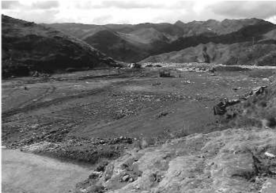
Fotografía 1 Relleno sanitario de Jaquira, Cusco

Machu Picchu y Ollantaytambo, por su parte, depositan los residuos sólidos en una cantera a unos 6 kilómetros de distancia de este último. Cabe indicar que los residuos de Aguas Calientes son trasladados por vía férrea hasta la estación de Pachar, en Urubamba, y los residuos inorgánicos son trasladados a la planta de segregación de la Municipalidad de Machu Picchu para su clasificación y reacondicionamiento, y posterior transporte en tren hasta el Cusco.