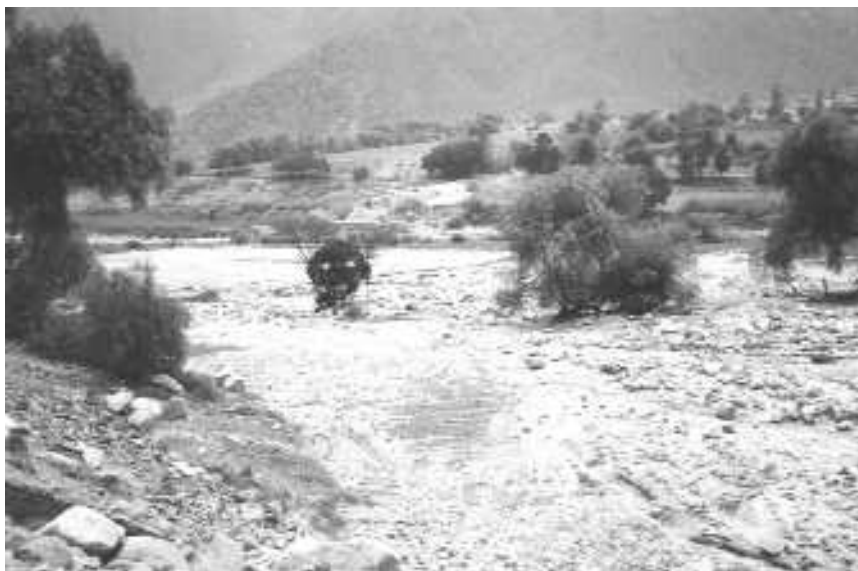
Fotografía 6 Afectación de la cuenca media por el fenómeno El Niño