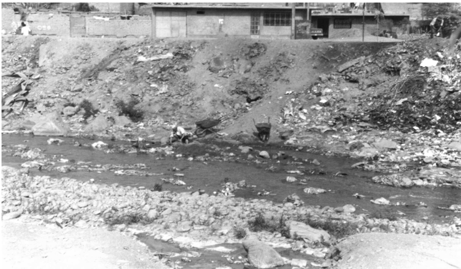
Fotografía 3 Cuenca baja del río Chillón