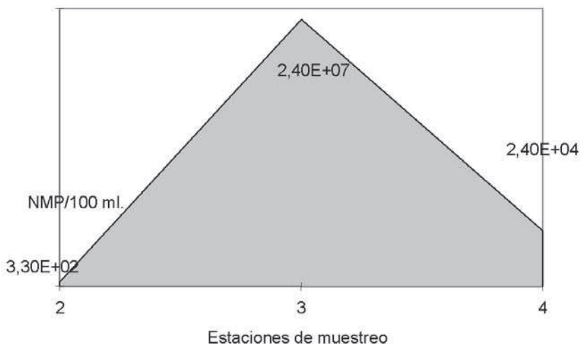
Gráfico 3 Coliformes fecales

Con respecto a la calidad fisicoquímica del agua en la cuenca alta del río Chillón, esta muestra condiciones favorables para actividades de pesca y recreativas. Si se tiene en cuenta que la evaluación fue realizada en época de bajo caudal, se puede prever que la calidad del agua del río será notablemente superior en época de alto caudal.