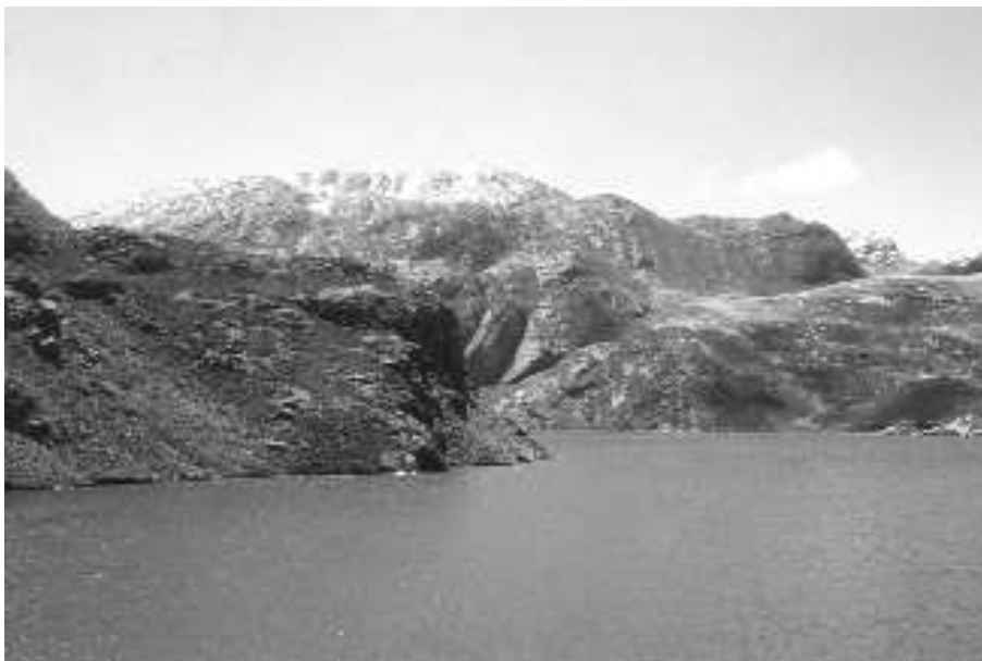
Fotografía 5 Cuenca alta del río Chillón