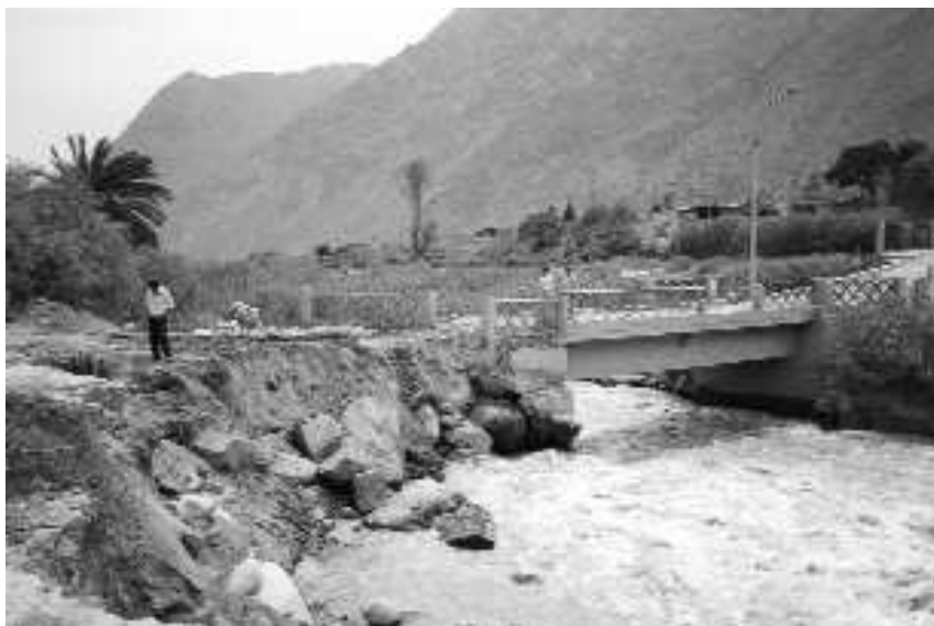
Fotografía 4 Cuenca media del río Chillón