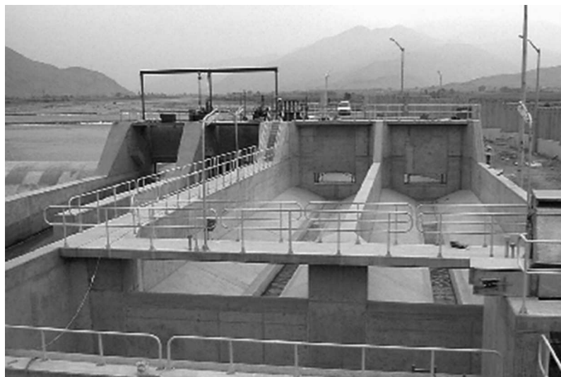
Fotografía 2 Vista general de la PTAR de Puente Piedra

La concesión consiste en la captación de las aguas superficiales y subterráneas de la cuenca del río Chillón, su tratamiento y la entrega a Sedapal para su posterior distribución a aproximadamente 750.000 habitantes en los distritos del norte de Lima (Carabayllo, Comas, Ventanilla, Ancón, Puente Piedra y Santa Rosa) a razón de 2,0 m 3 /s entre diciembre y abril (época de lluvias, cuando el abastecimiento proviene de aguas superficiales) y 1,0 m 3 /s entre mayo y noviembre (época de sequía, cuando el abastecimiento proviene de aguas subterráneas).