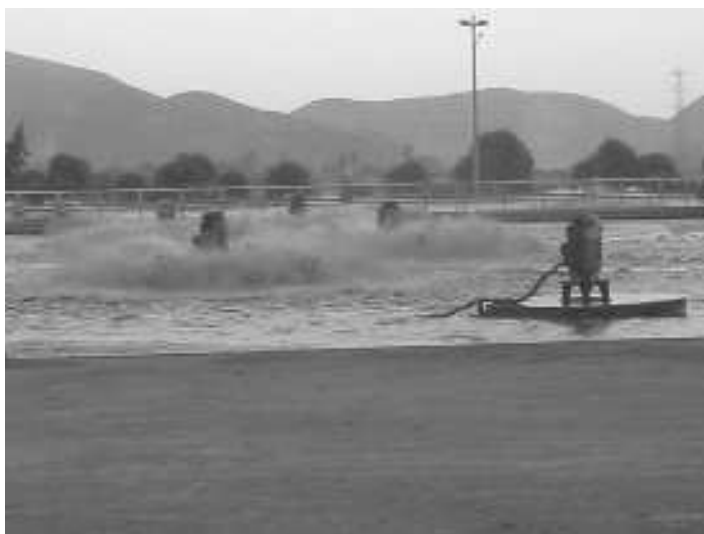
Fotografía 1 Vista general de la PTAR de Puente Piedra

En la fotografía 1 se muestra la vista general de la PTAR de Puente Piedra.