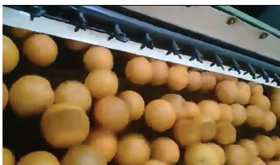
Encerado de la fruta

Después del encerado, vuelve a pasar por el horno para secar la cera con la que ha sido impregnada la fruta. La fruta es redirigida hacia el área de embalaje, en donde el personal la acomoda en rejas de plástico para darle una salida más segura del lugar.