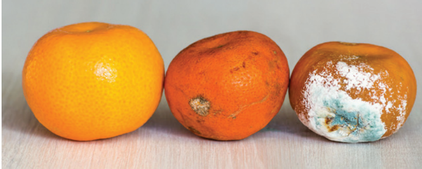
Imagen de una naranja sana, madura y podrida