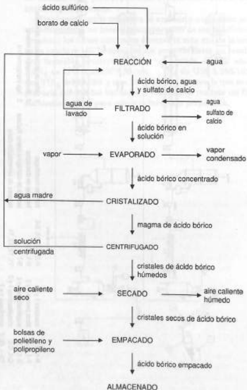
Diagrama de bloques del proceso (línea de ácido bórico)