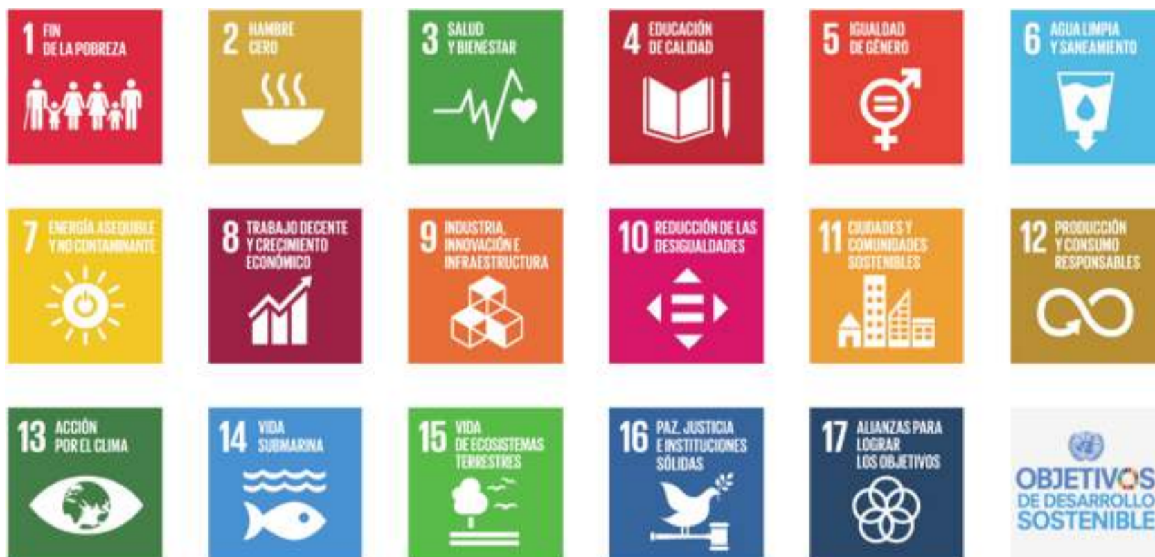
Figura 1. Objetivos de desarrollo sostenible 1

Las empresas podrán descubrir nuevas oportunidades de crecimiento y reducir sus perfiles de riesgo mediante el desarrollo y la entrega de soluciones para el logro de los ODS. Las empresas pueden utilizar los ODS como un marco general para dar forma, dirigir, comunicar y reportar acerca de sus estrategias, metas y actividades, lo que les permitirá capitalizar una serie de beneficios. Estos incluyen, según refiere SDG Compass (2015), los puntos siguientes.