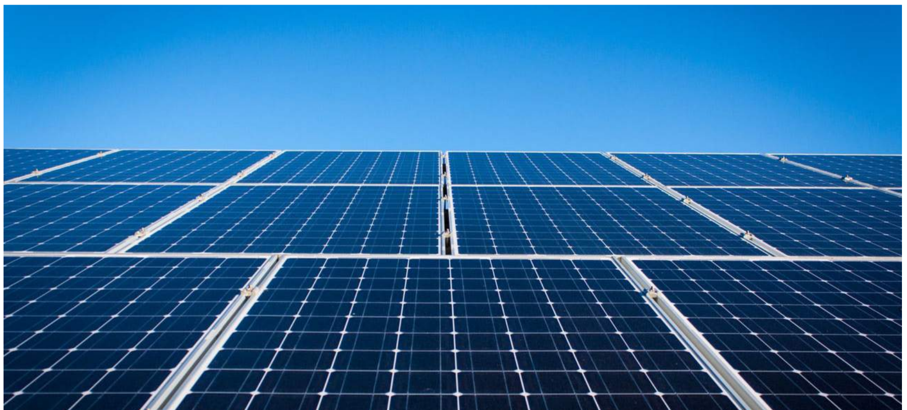
Figura 6. Energías renovables

En la figura 5 se muestra un estimado de los impactos económicos directos asociados con problemas