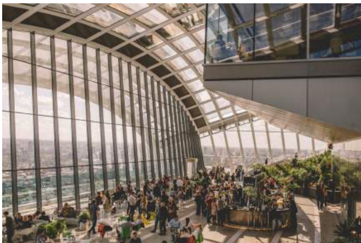
Figura 2. Equilibrio ecológico

Sin embargo, se ve que los objetivos menos trabajados son aquellos más enfocados a la acción social