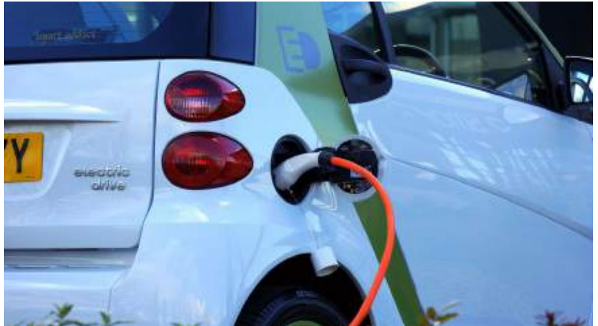
Figura 3. Energía limpia

Según refiere la guía de los CEO sobre los ODS, es importante que las empresas sean conscientes de sus obligaciones fundamentales.