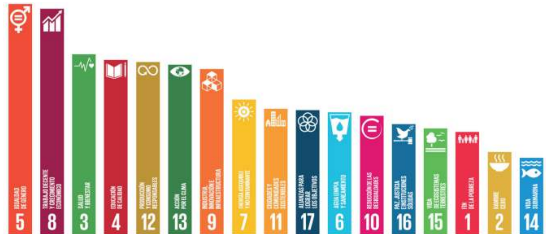
Figura 4. ODS vinculados a las estrategias de negocio de las empresas españolas

2. Nuevas reglas en los mercados. Las empresas con visión de futuro están llevando adelante nuevos modelos de negocio disruptivos que amenazan con cambiar radicalmente los mercados.