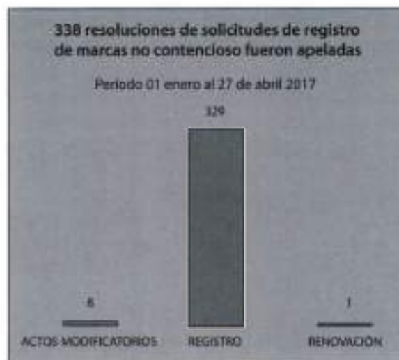
Gráfico N° 1