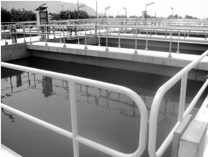
Figura 5 Filtros de gravedad

la compuerta de lavado de tal manera que al disminuir bruscamente el nivel de agua dentro del filtro, el agua filtrada contenida en los canales laterales invierte su patrón de flujo debido a que tienen un mayor nivel, realizándose así el retrolavado que agita el lecho de arena y elimina las partículas por medio del canal de lavado. Luego de terminado el retrolavado se cierra la compuerta de lavado y se abre la compuerta de ingreso para restablecer el proceso de filtrado.