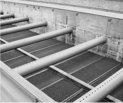
Figura 3 Sedimentadores laminares

fila de módulos formados por planchas onduladas de polipropileno e instaladas con un ángulo de 60°. El flujo de agua clarificada en cada nave es ascendente y es transportado por un sistema de tuberías de PVC hacia un canal central abierto que separa las naves. Cada módulo tiene en su parte inferior tolvas de recolección de lodos (figura 4).