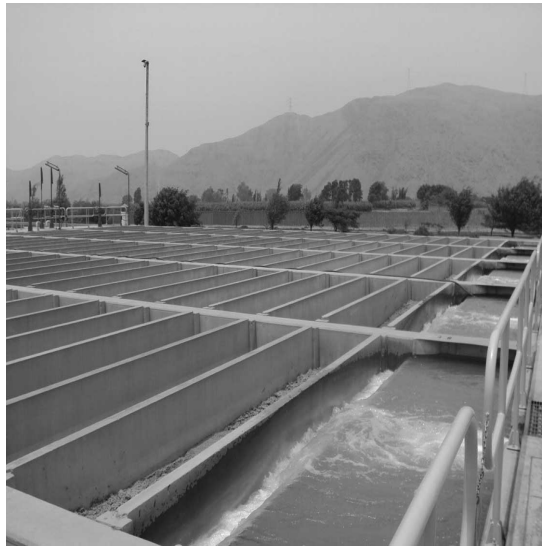
Figura 2 Mezcla rápida: Canales Parshall