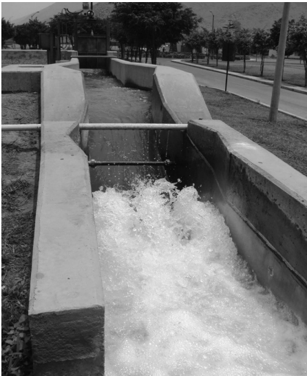
Figura 1 Mezcla rápida: Canales Parshall

En la figura 1 se observa que la mezcla rápida está constituida por canales Parshall y es allí donde se produce la inyección del coagulante, mientras que en la figura 2 se observan floculadores con pantallas y flujo vertical.